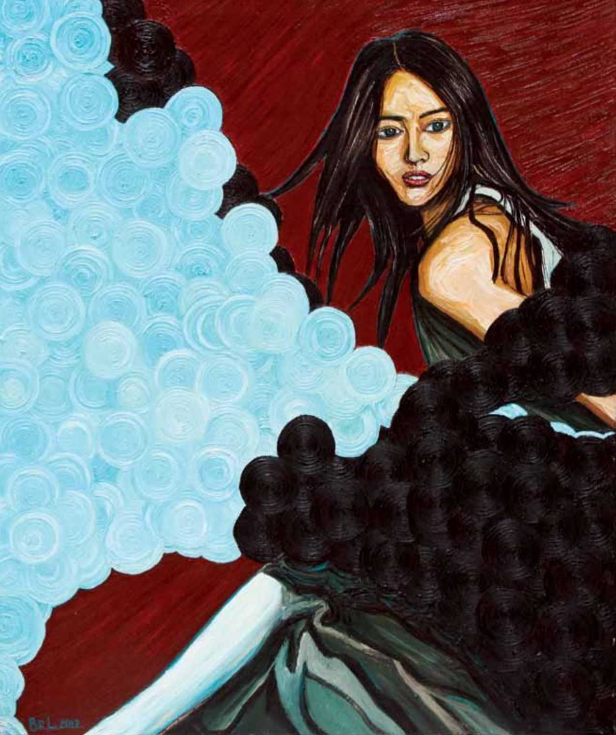
Temptation Oil on canvas 120 x 100 cm 2012