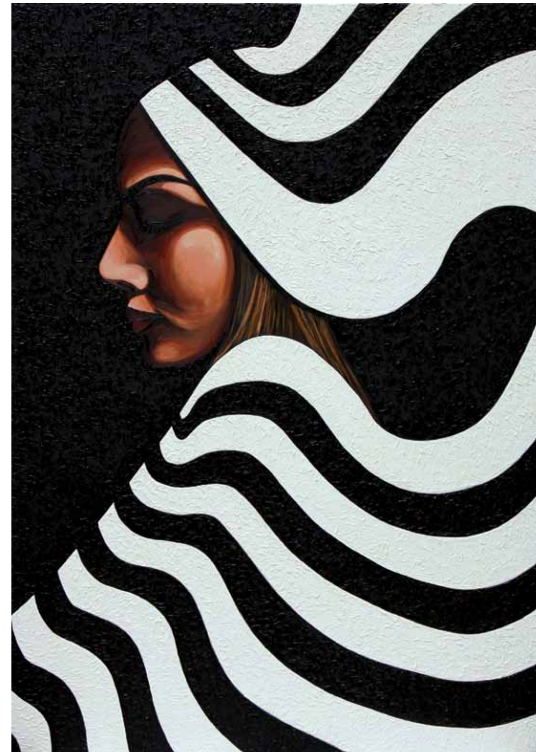
Nun Oil on canvas 140 x 100 cm 2014