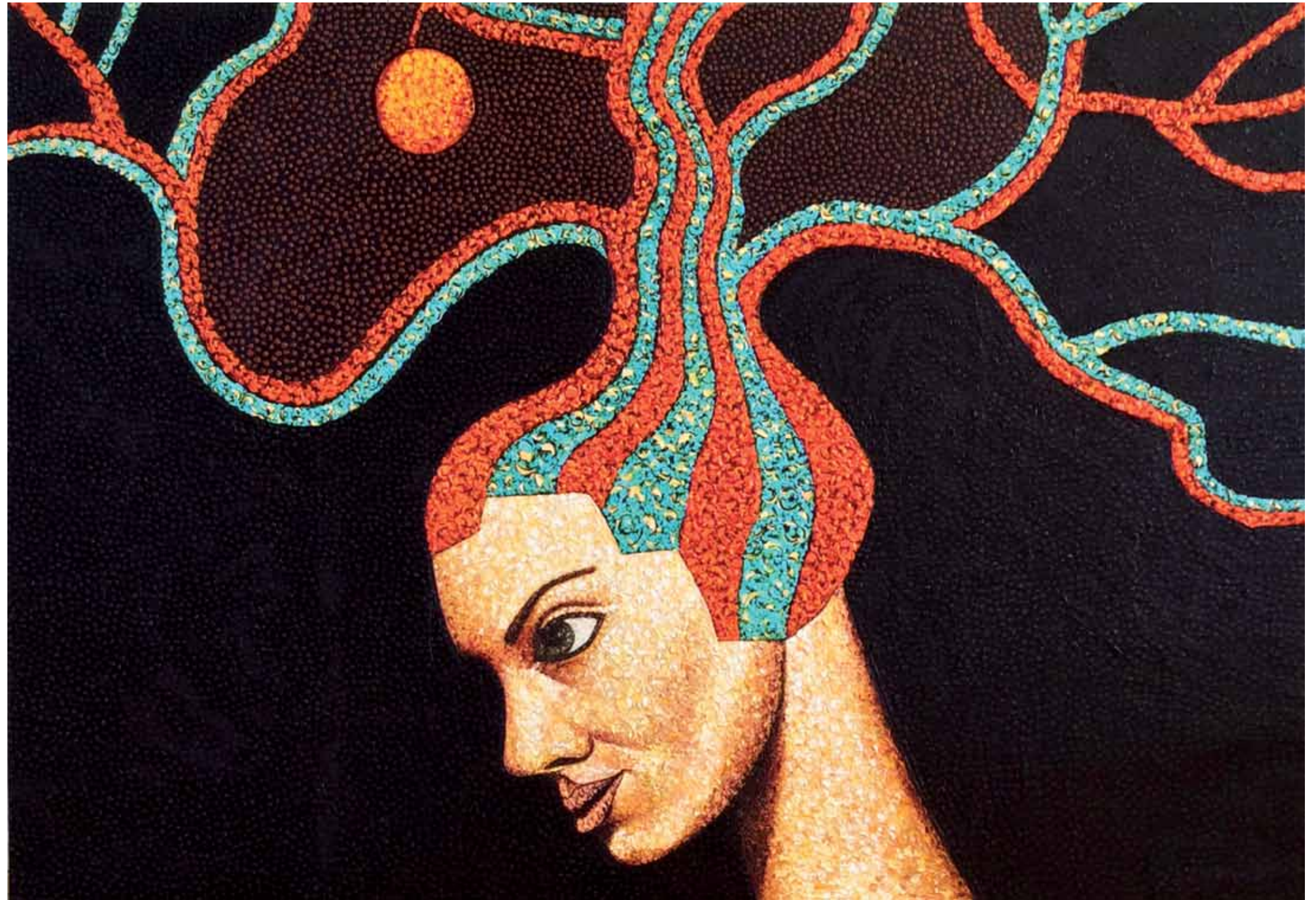
Eva Oil on canvas 100 x 140 cm 2014