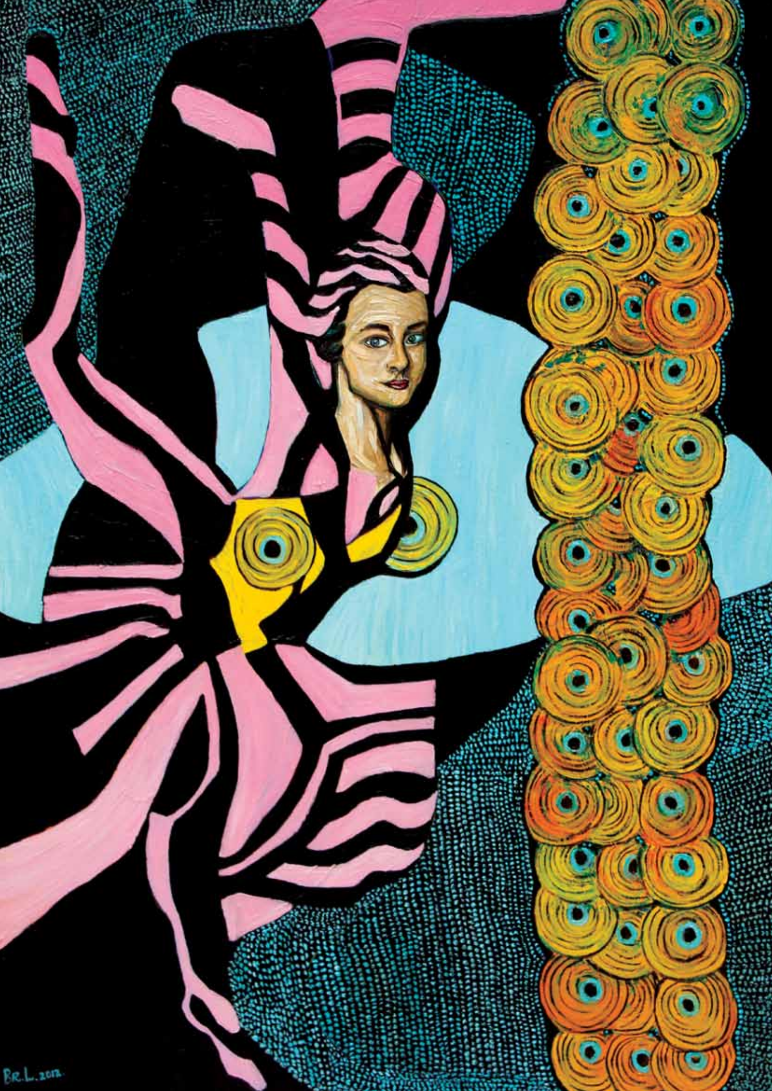
Swan Lake Oil on canvas 140 x 100 cm 2012